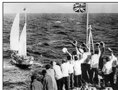
Nuotraukoje Knox-Johnson grįžta 1969.04.22.