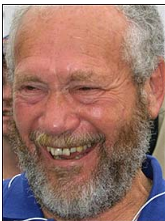
Tai iššūkis jai, kaip tai buvo ir man Seras Robinas

Ellen yra 28 metų. Gimusi Britanijoje, Derbišyre (Derbyshire). Jos ūgis tėra 1.57 m. Robin-as Knox-Johnson, 65-ių metų vienutininkas, kuris 1969 metais pirmas apiplaukė Žemės rutulį be sustojimų “The Sunday Times Globe” reise su 32 pėdų medine jachta “Sugaili” per 312 dienas, pasakė: “Klaidinga galvoti, kad viskas priklauso nuo muskulų. Vienutinis buriavimas priklauso nuo smegenų. Ūgis yra netgi ne antras dalykas pagal svarbą. Nemanau, kad baimė įeina į sąrašą. Daugelis nuvargusių žmonių neatsikeltų eiti į denį ir patikrinti – ar viskas gerai. Geras vienutininkas