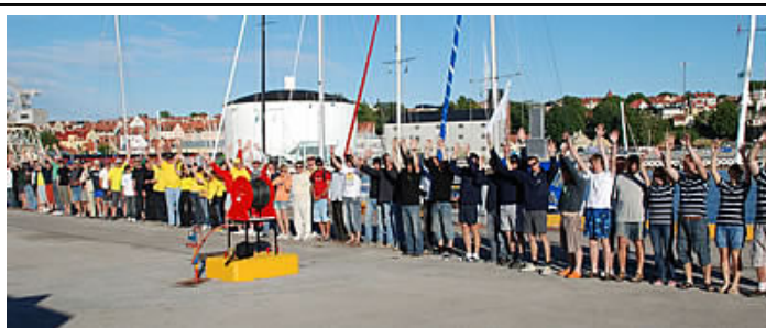
2008 m. Žalčių Karalienės regatoje dalyvavo 109 įgulų nariai.

Kaip ir buvo tikėtasi, greičiausių jachtų savybes pademonstravo naujaisi vokiečių DELHLER prekinio ženkle laivai "Lady L" ir "Baltas".