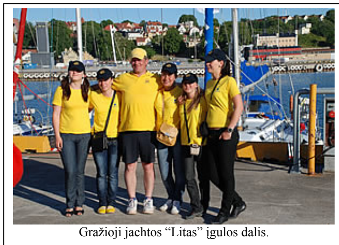
Gražioji jachtos "Litas" įgulos dalis.

Tai didelis ir praktinis buriuotojų meistriskumo ir žmogiškųjų savybių testas. Neplaukę tikroje jūrinėje regatoje buriuotojai negali savęs vadintis jūriniais buriuotojais. Antra svarbi išvada – stovintis takelažas turi būti keičiamas nepriklausomai nuo patenkinamos vizualios apžiūros rezultatų. Lenktyninėse jachtose – kas 5 metai, kelioninėse jachtose – kas 10 metų. Nerūdijantis plienas pavargsta nuo ciklinių apkrovų, užsigrūdina ir praranda elastingumą (tampa trapus). Kiekvienas gūsis, kiekvienas