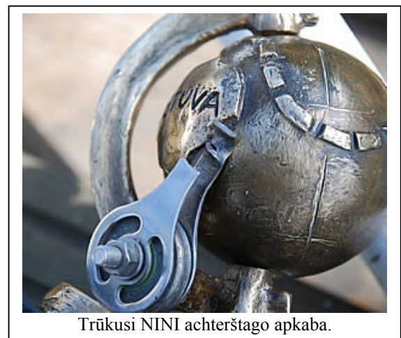
Trūkusi NINI achterštago apkaba.