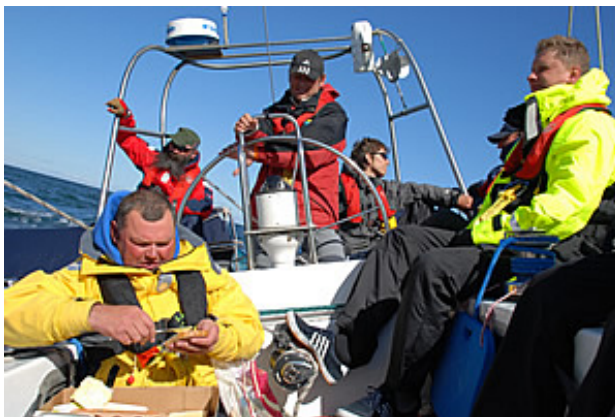
Jachtos "Vakarė" įgula, sugaišusi pirmame etape 26:15 val (174jm) ir 32:22 valandas antrame etape (203jm).

uostas. Visos rėmėjų lėšos buvo panaudotos regatai: prizams, ženkliukams, diplomams, laivų stovėjimo išlaidoms Visbyje. Kadangi regata kasmet sulaukia vis didesnio skaičiaus rėmėjų, ateityje būtų gerai surinktas lėšas panaudoti tam, kad kiekvienas regatos dalyvis, net nelaimėjęs jokios vietos, iš karto gautų jūroje būtinų šiltų buriuotojiškų reikmenų: pirštinių, kepurėlių, šalikų. Juk jūra – tai didelis akumulatorius, išlaikantis šaltį net iki vasaros vidurio.