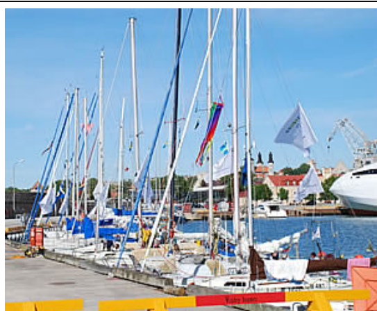
Žalčių Karalienės regatos laivynas Visbyje.

Šių metų "Žalčių Karalienės" regata buvo pilna naujovių: