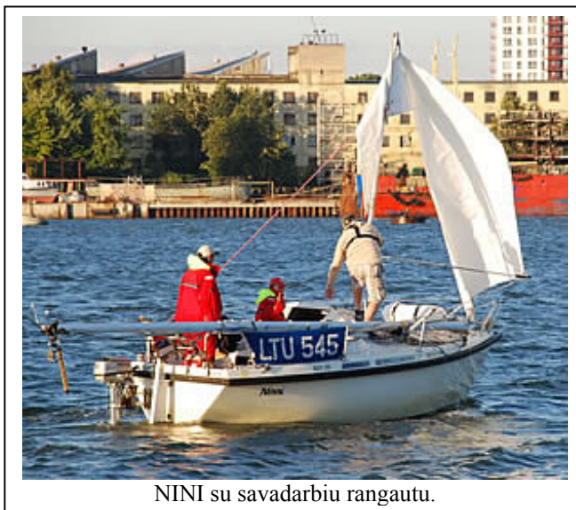
NINI su savadarbiu rangautu.

vykusiame antrajame etape. Jachtos "Nini" įgulai teko tikri jūriniai išbandymai. Jų stiebas lūžo antrajame etape, jachtai esant 90 jūros mylių atstumu nuo Klaipėdos. Trūko pavargusi achterštago jungtis. Įgula nepabūgo vėjo ir bangų, patys užsikėlė stiebo liekanas ant laivo, pasidarė laikiną stiebą iš spinakergiko, iškėlė štorminį stakselį ir grįžo namo su burėmis. Kiti seniai būtų kvietę gelbėtojų sraigtasparnį. Vėlai vakare Smiltynės jachtų uoste švenčiantys buriuotojai išsirikiavo krantinėje, kad sukeltų ovacijas grįžtantiems "Nini" buriuotojams.